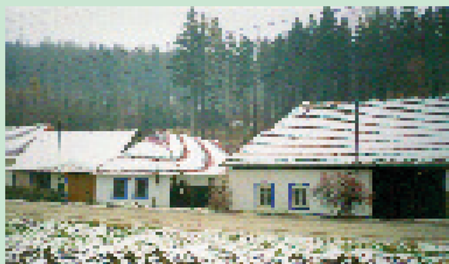
Vápenky - památková zóna

Poslední vlnou osídlení na úpatí masivu Javořiny je dělnická osada Vápenky založená koncem 18. století na hranici tehdejších statků ostrožského a stránického. Jméno nese od těby vápence pro potřeby sklárny v Květné. Kromě těby vápna se místní lidé živilí prací v lese a pálením dřevěného uhlí.