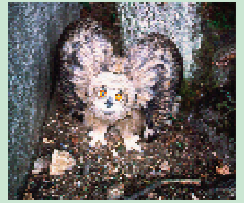
mladý výr velký