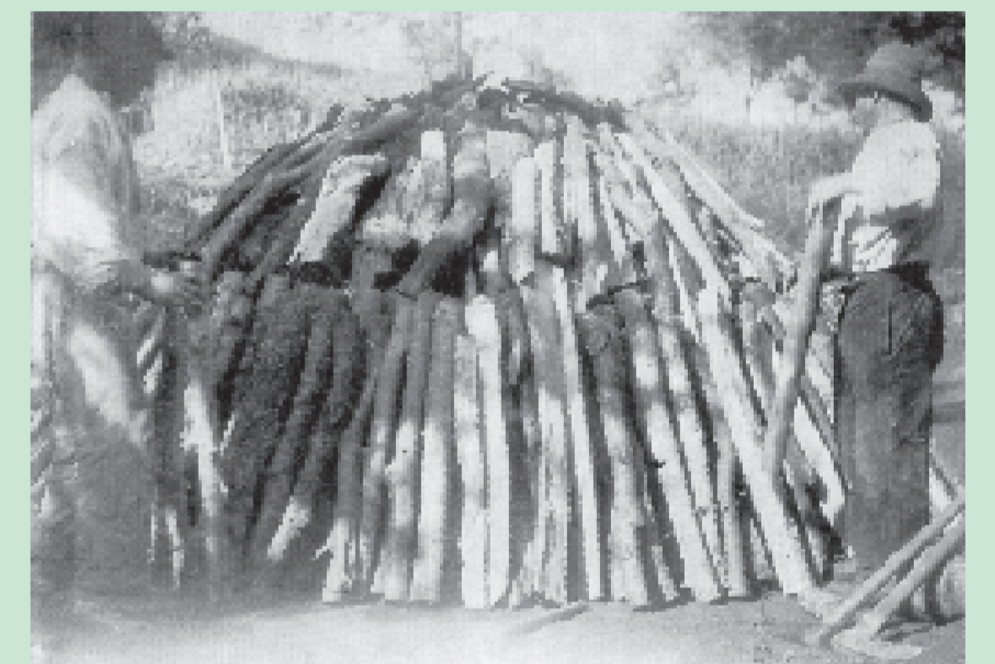
pálení dřevěného uhlí na počátku 20. století

Jak je vidět, je zde zachována řada malebných domků místních dělníků-zemědělců. Komplex těchto domků je chráněn jako památková zóna. Od roku 1972 patří celá osada do katastru obce Nová Lhota. Od 70. let na svahu nad obcí vznikala chatová kolonie, která je dnes stabilizována. U silnice je rekreační areál s koupalištěm, v osadě je pohostinství.