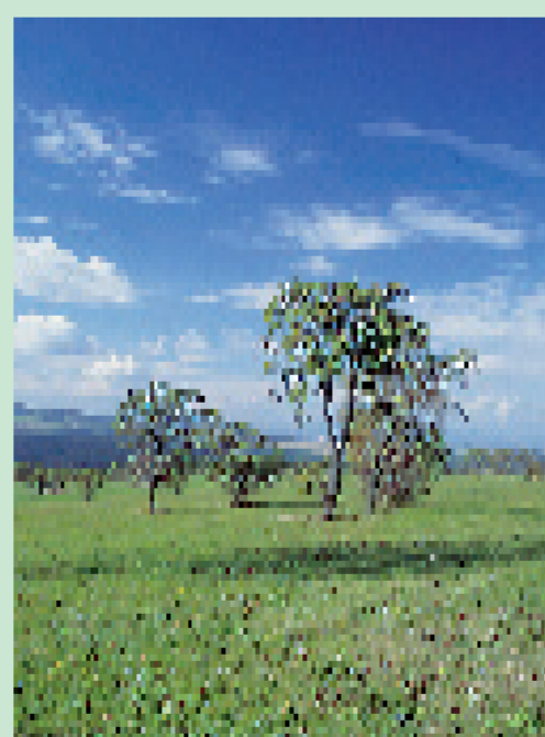
soliterní stromy v NPR

V NPR Porá•ky a Jazevčí se vyskytuje mnoho dalších chráněných a krásných druhů rostlin např. tořič čmelákovitý, pětiprstka •eulník, střevíčník pantoflíček, kosatec trávovitý, hořepník luční.