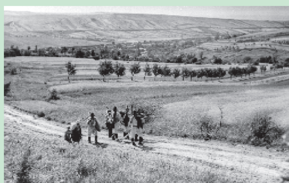
kosáci nad Javorníkem

Na Horňácku, ač je v hornaté oblasti, se tradičně uplatňoval rovinnatý způsob tzv. tračového hospodaření. Pole, louky i lesy byly rozděleny do dlouhých pásů, od údolí po hřeben. Každý pás byl původně obhospodařován jednou rodinou.