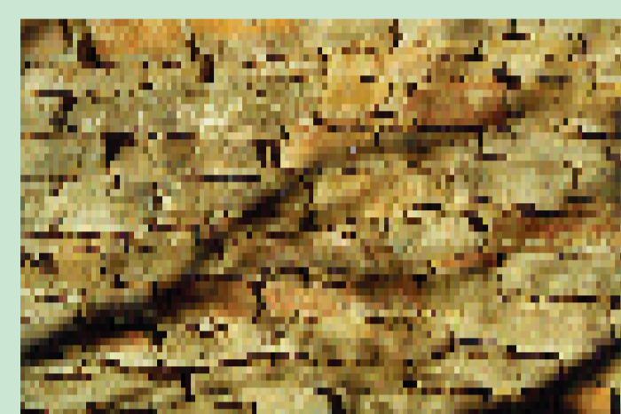
kamenná zeď stodoly

Na starobylost zástavby ukazuje tvar domků s valbovou střechou, která donedávna nesla slaměnou „doškovou“ střechu a dnes pálenou taškovou krytinu. Historickým prvkem jsou i roubené (skládané z trámů) seníky a stodoly.