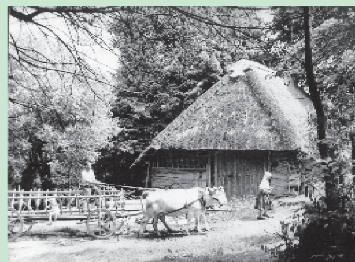
roubená stodola s valbovou střechou

Na starobylost zástavby ukazuje tvar domků s valbovou střechou, která donedávna nesla slaměnou „doškovou“ střechu a dnes pálenou taškovou krytinu. Historickým prvkem jsou i roubené (skládané z trámů) seníky a stodoly.