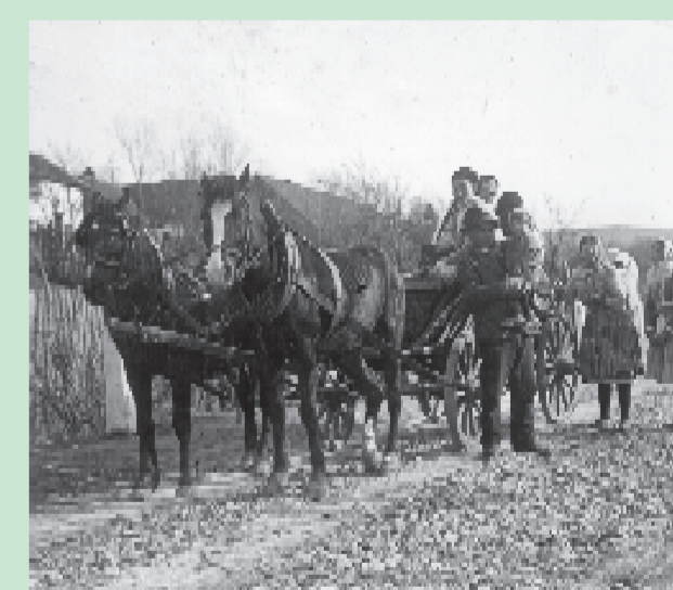
odjezd za prací do Rakous (1932)

Ač je to překvapivé i v okolí Javorníku rostly vinohrady. Vinohradnictví upadlo koncem 19. století, po velkém přemnožení révokaze. Po slabé úrodě v roce 1879 zde hrozil hladomor a lidé proto začali vyjíždět za prací do Rakous a na Jižní Slovensko.