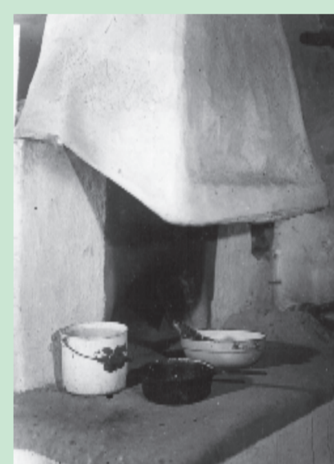
ohniště s kozubem

V interiérech domů, které jsou dodnes obývány, se zachovalo původní členění prostoru slováckého domu na jizbu, síň a komoru. Jizba byla hlavním obytným prostorem s okny do ulice, kde se jedlo a spalo. Síň je místnost, do které se vstupuje a sloužila k vaření i jako místo drobných prací. Dodnes je v některých z nich zachována i černá kuchyně, kde se vařilo na otevřeném ohništi a kouř stoupal ke stropu, nověji byl odváděn komínovým nástavcem - kozubem.