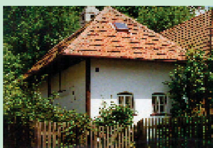
domky v Kopánkách

Za vesnickou památkovou zónu byl v roce 1996 vyhlášen zachovalý soubor staveb ve východní části obce Javorník. „Kopánky“ je tradiční název pro tuto část obce, kde bydleli jen malí rolníci a bezzemci. To ukazuje i charakter výstavby, kdy jsou jednotlivé usedlosti vtěsnány k sobě.