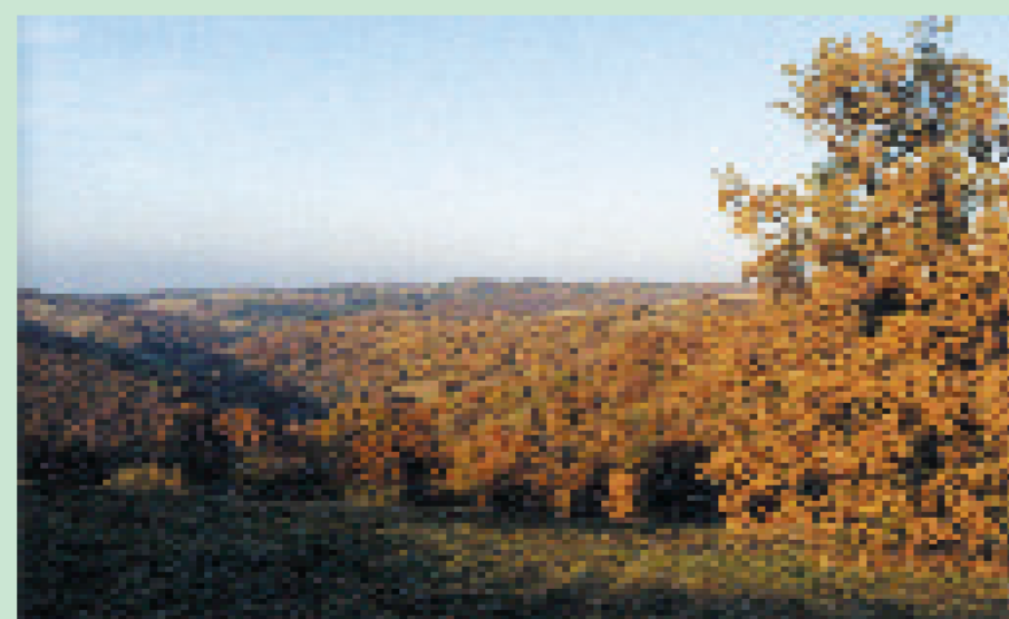
Jazevčí nad Javorníkem (1930 a 1999)